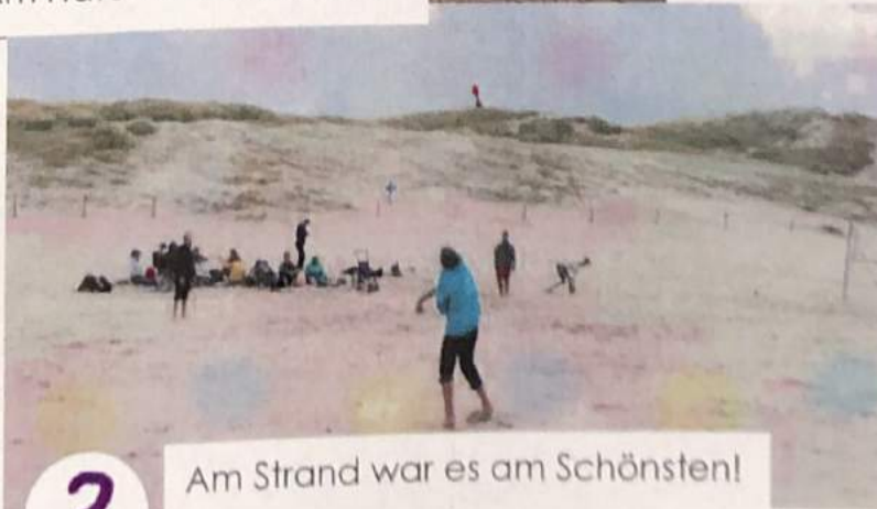
Am Strand war es am Schönsten!