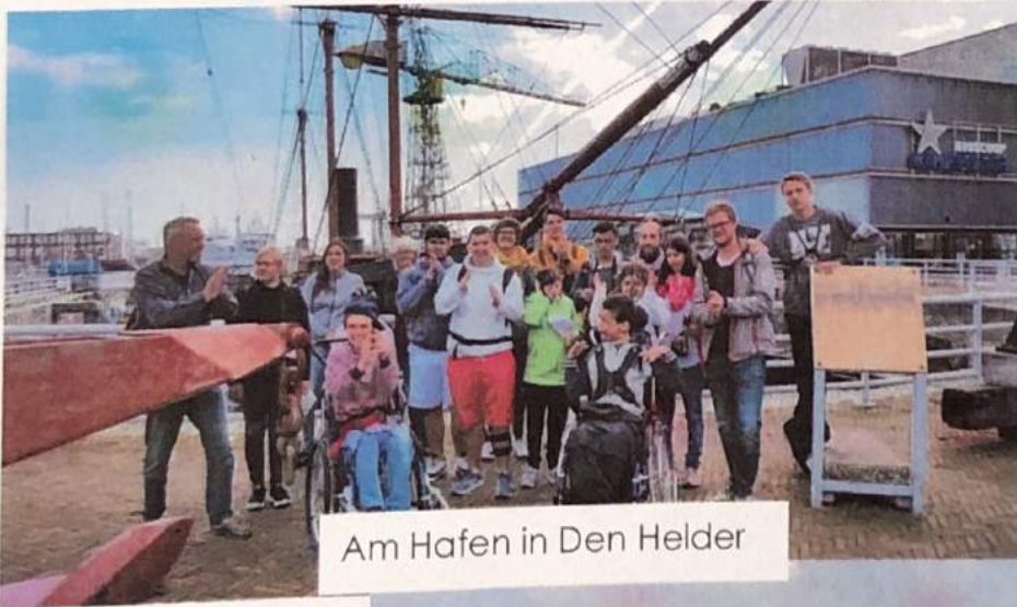
Am Hafen in Den Helder