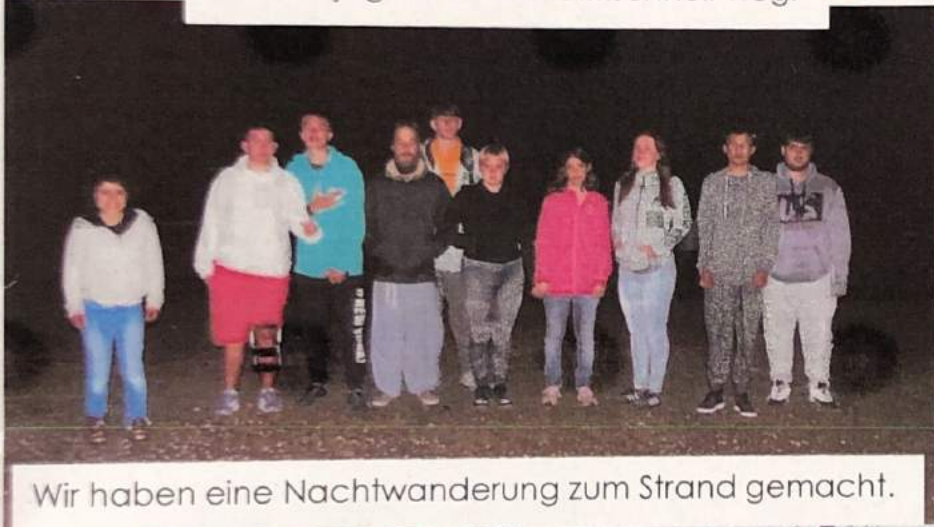
Wir haben eine Nachtwanderung zum Strand gemacht.