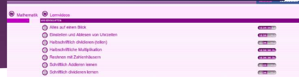
Abb: Angebot an Lernvideos Mathematik